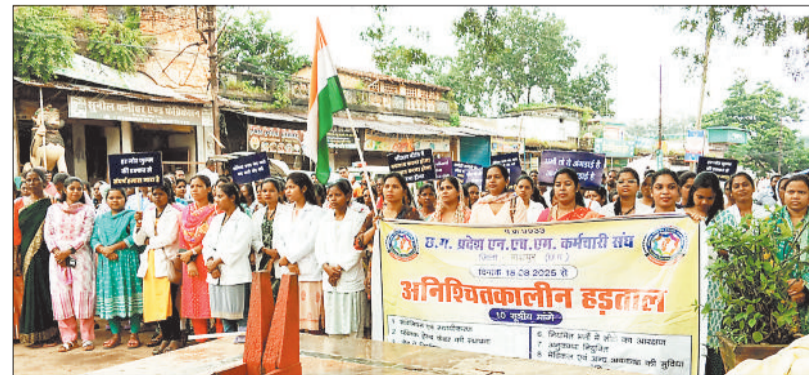
मनोकामना यात्रा में शामिल एनएचएम कर्मचारी।

जिले की स्वास्थ्य व्यवस्था स्टाफ की भारी कमी से जूझ रही है। एनएचएम कर्मचारियों की नियमितिकरण सहित 10 सूत्रीय मांगों को लेकर शुरू हुई हड़ताल शुक्रवार को 26वें दिन भी जारी रही। हड़ताल की अवधि बढ़ते ही जिले की स्वास्थ्य सेवाएं पूरी तरह चरमरा गई हैं। सरकारी अस्पतालों में मरीजों को गुणवत्तापूर्ण सुविधा नहीं मिल पा रही है। केंद्र और राज्य सरकार स्वास्थ्य क्षेत्र को सुदृढ़ करने तथा राष्ट्रीय स्वास्थ्य कार्यक्रमों के सुचारू संचालन हेतु करोड़ों रुपये खर्च कर रही है, किंतु एनएचएम कर्मचारियों की जायज मांगों पर सरकार के अडिगल रवैये के कारण इन योजनाओं का लाभ आम जनता तक नहीं पहुंच पा रहा है। प्रशिक्षित व कर्तव्यनिष्ठ कर्मचारियों की अनुपस्थिति का सीधा असर प्रदेश की स्वास्थ्य व्यवस्था पर पड़ रहा है।