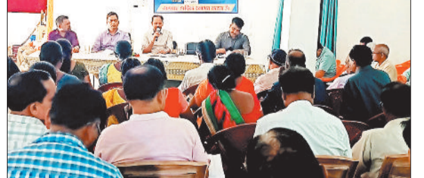
प्रधान पाठकों की बैठक लेते एसडीएम।