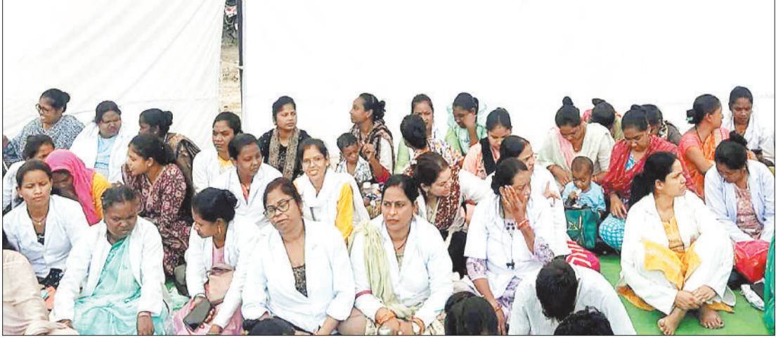
धरना-प्रदर्शन में शामिल एनएचएम कर्मचारी।