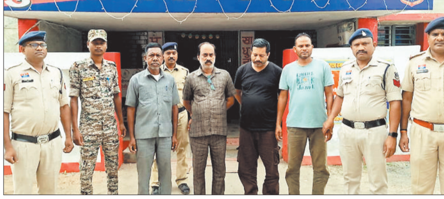
पुलिस गिरफ्त में टगी के चारों आरोपी।

पुलिस के अनुसार वर्ष 2021 से 2024 तक आरोपियों ने आर.पी. ग्रुप नामक फर्जी कंपनी बनाई। इस कंपनी के संचालकों ने ग्रामीणों को यह विश्वास दिलाया कि कोरबा जिले के मंडवारांनी क्षेत्र में एक जादुई कलश मिला है, जिसे भारत सरकार विदेशों में अरबों रुपये में बेचेगी। कंपनी से जुड़ने वाले हर सदस्य को 1 से 5 करोड़ रुपये तक का मुनाफा मिलेगा। यही नहीं, ग्रामीणों से कहा गया कि विदेशियों को बुलाने, उनकी आवश्यकतें करने और कलश की बिक्री प्रक्रिया के लिए खर्च की जरूरत है। इसी बहाने उनसे सिक्योरिटी मनी और प्रोसेसिंग फीस के नाम पर 25 हजार से लेकर 70 हजार रुपये तक वसूले गए।